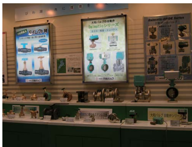
写真：第 43 回管工機材・設備総合展（東京）の展示会より