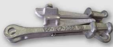
材質: AC7A, FCD450