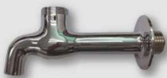
材質: CAC406(ニッケルメッキ仕上げ)